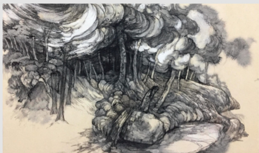
中澤 美和 / 《廻りの森》 / 2020年 cliff-edge.org

この展覧会を通じて、三つの会場の持つ意味と相互の関係性を読み解きながら、時代を超えて躍動する大自然の大きな力に思いを馳せていただければ幸いです。