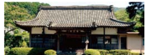
溪月山 長光寺 静岡県田方郡函南町畑88-1