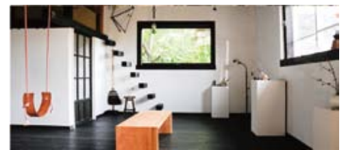
KURUBUSHI-BASE 静岡県田方郡函南町丹那315-1