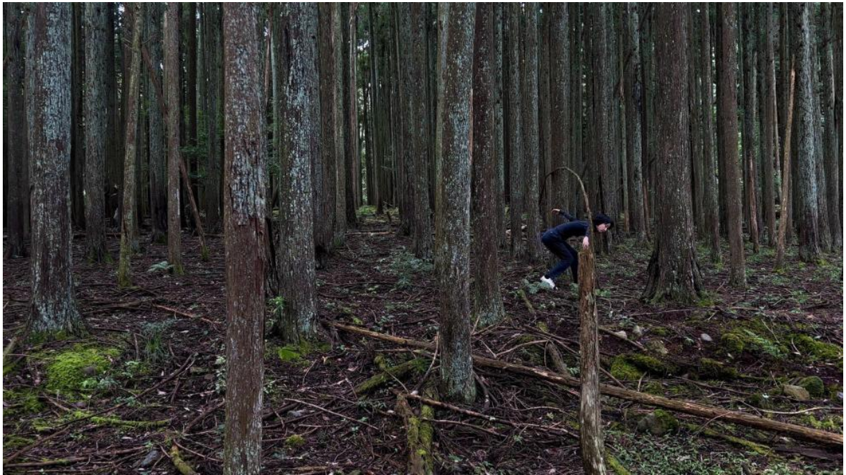
椎の木平の巨木付近