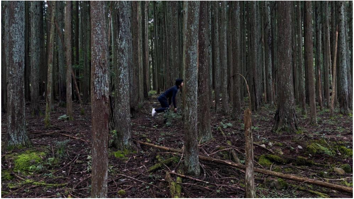
椎の木平の巨木付近