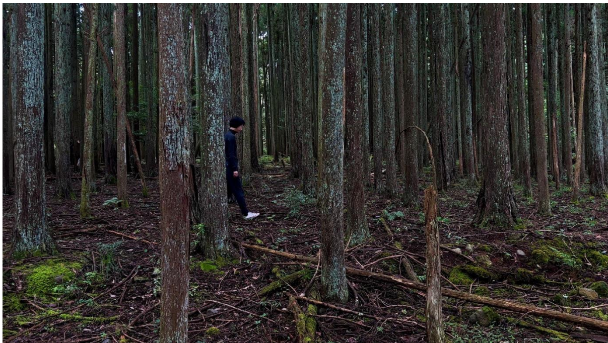
椎の木平の巨木付近

10/14、水神社の祭典に立ち会う、小雨と神社から聴こえてくる雅楽の生演奏が至福の相性で、景色と共に身体に染み込む。地元の限られた男性のみ神社内に入れる。女性は未だ中には入れないとのこと。この昔からの風習を目の当たりにしながら、美しいわさび田を眺めた。湧水に触れ、口に含む。