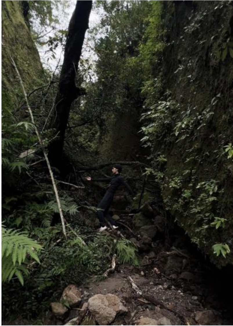
椎の木平の巨木付近